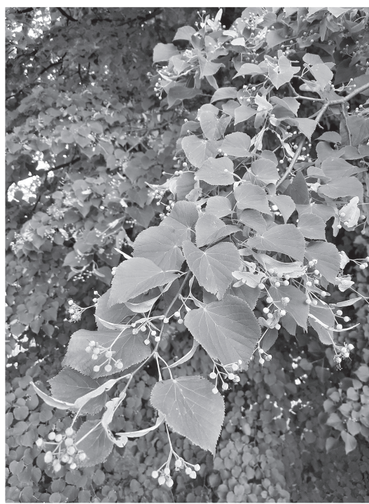
Naším národním stromem je lípa

Lipový med je jeden z nejlepších a jeho použití k léčivým účelům bylo známo už před šesti tisíci lety v Egyptě a ve starém Řecku. Medem se léčily rány, celá řada chorob, uchovávalo se v něm maso, aby se nekazilo. Odvar z lipových květů je tradiční prostředek pro pocení při nachlazení, nebo se používá jako kloktadlo.